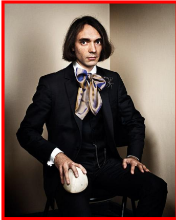
2. Cédric Villani muni d'un sphéroforme de Meissner Photo : Jérôme Bonnet pour Télérama. II

écrans séparés, par exemple). Mon fils a préféré s'essayer au puzzle sur tableau magnétique inspiré des mêmes pavages : « il n'y a pas de forme fixée, mais des formes qu'ont peut créer; pas un seul puzzle, mais pleins de résultats possibles. »