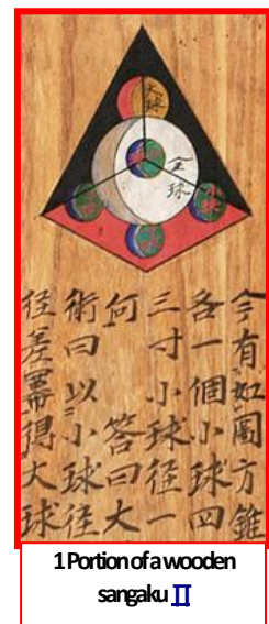
1 Portion of a wooden sangaku II

La fondation Cartier ne prétend pas que Mathématiques, un dépaysement soudain soit une exposition d'art contemporain. Elle « se propose d'offrir à tous des fragments de splendeur mathématique. » Dans une scénographie monumentale due à David Lynch et une ambiance sonore inquiétante qui rappelle celle de ses œuvres cinématographiques, ce sont surtout des films qui sont exposés (une sculpture et des robots font exception). Je reviendrai sur l'un d'entre eux qui m'a touché. Mon point de vue est celui d'un mathématicien accompagné de son fils de 7 ans et, en cela, diffère sensiblement de ceux qu'adoptent Catherine Lazarus-Matet dans LQ n°72 et Rose-Paule Vinciguerra dans LQ n°74.